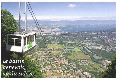
Le bassin genevois, vu du Salève.